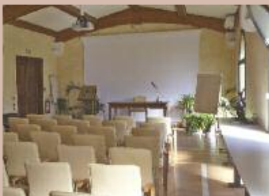
SALLE “SAINT VINCENT”

Pour vos réunions , nous mettons à votre disposition deux salles de conférence, toutes deux climatisées, équipées de volets roulants électriques, d’un écran géant, d’un vidéo-projecteur plafonnier et de tout l’équipement audio dont vous avez besoin.